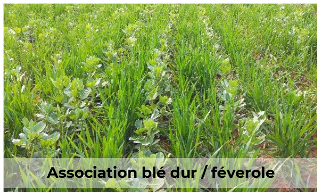
Association blé dur / féverole

Les périodes d'intercultures peuvent être mises au service de la fertilité des sols et notamment à l'amélioration de l'autonomie azotée du système de cultures ! On considère que les cultures intermédiaires à base de légumineuses fournissent en moyenne 30 à 40kg N/ha de plus qu'un sol nu ou qu'un couvert de non légumineuses. Ces performances résultent d'importantes quantités d'azote stockées dans leurs parties aériennes et d'un faible rapport C/N : ces caractéristiques viennent favoriser et accélérer la dégradation et la minéralisation des résidus.